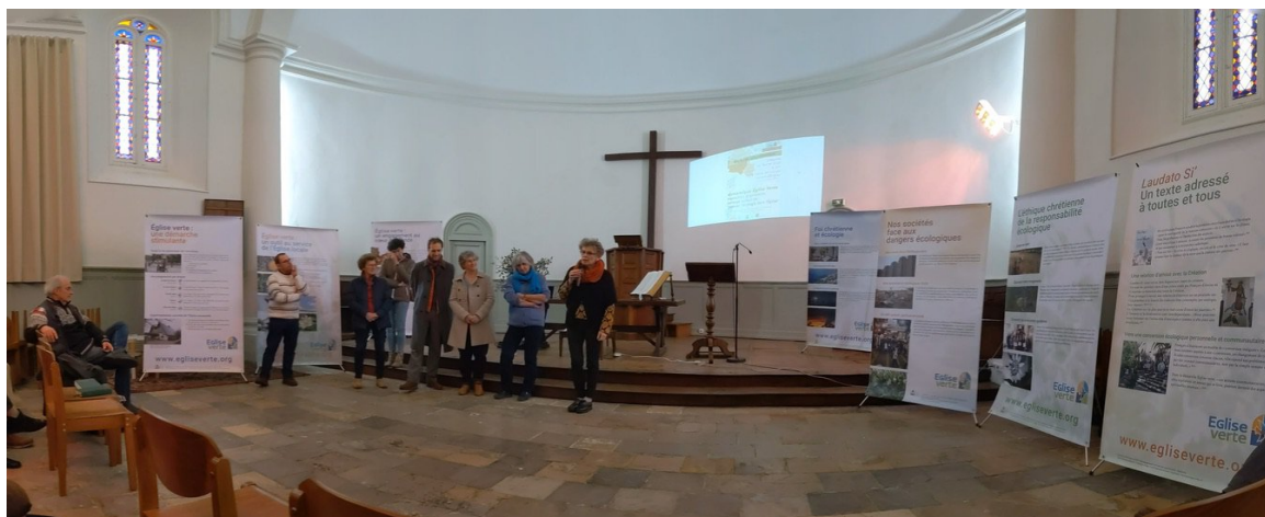
Journée église verte Temple d'Orthez 1er février

La venue d'une cinquantaine de personnes du consistoire pour un thème neuf ou mal connu, en voilà une bonne surprise ! Et si la « galette » n'y était pas pour rien, elle n'en était pas la seule motivation ! En effet, l'initiative de ce 1er février après-midi visait à annoncer une année Église Verte dans notre consistoire.